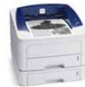
Phaser 3250 con Bandeja 2 opcional